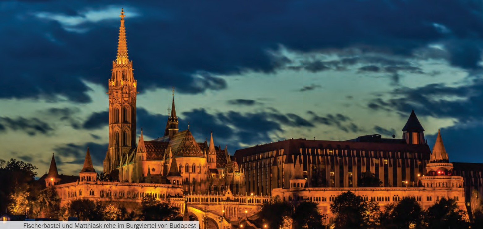
Fischerbastei und Matthiaskirche im Burgviertel von Budapest