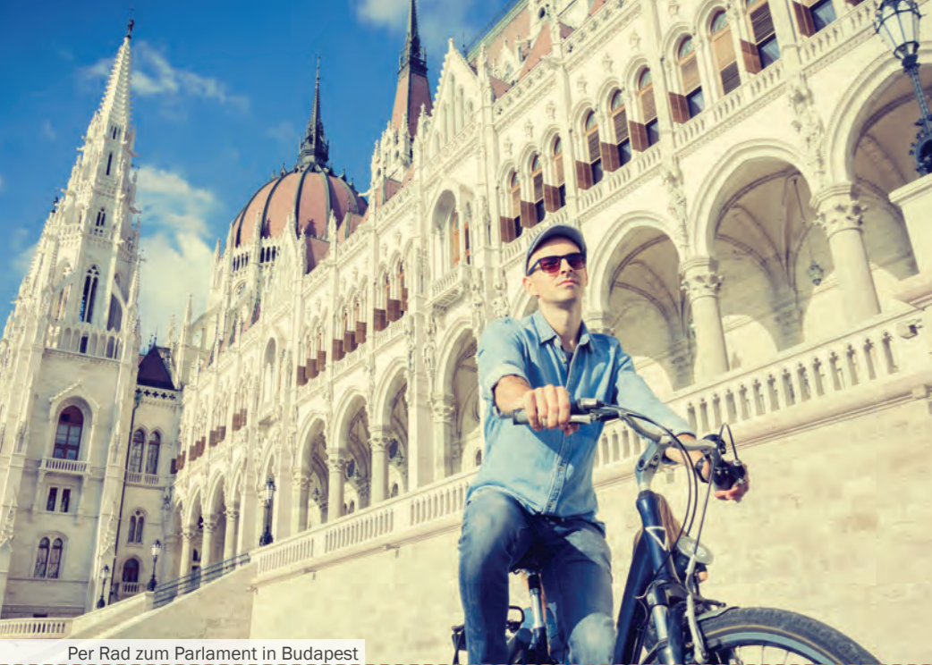
Per Rad zum Parlament in Budapest