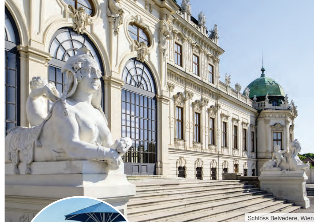
Schloss Belvedere, Wien