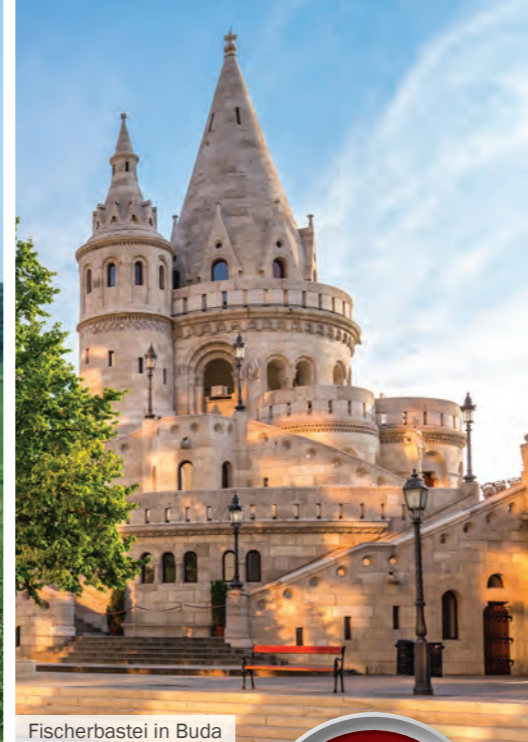
Fischerbastei in Buda