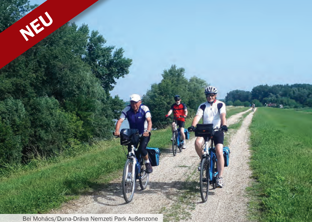
Bei Mohács/Duna-Dráva Nemzeti Park Außenzone