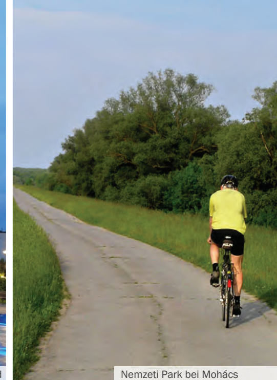
Nemzeti Park bei Mohács